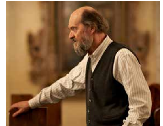
Arvo Pärt.

Lunds akademiska kör framför Maurice Duruflés stämningsfulla Requiem för kör, orgel och stråkkvintett från 1947. Duruflé bygger sitt Requiem på de gamla gregorianska melodierna, med franska dofter och en virtuos orgelstämma. Varmt välkomna att inleda Allhelgonaveckan med ett av de musikhistoriens vackraste Requiem. FRI ENTRÉ