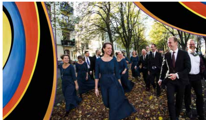
Contemporary Choir.