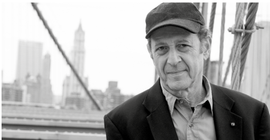
Steve Reich.