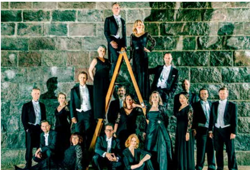
DR Vokalensemblet.