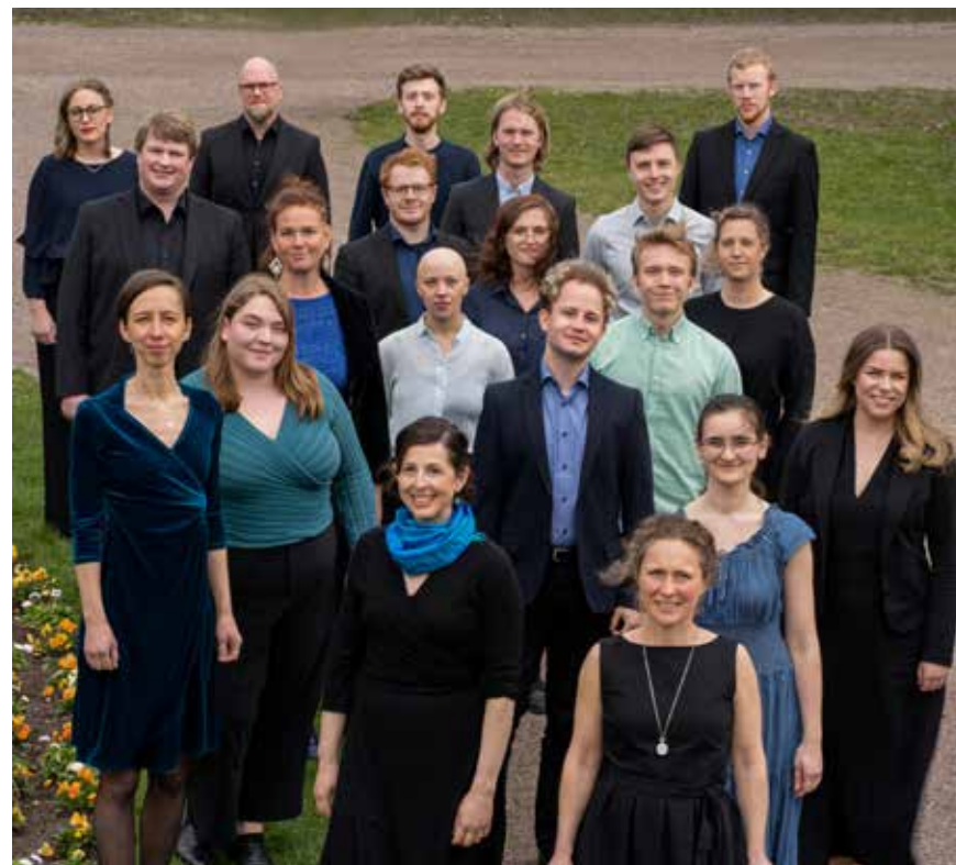
Palaestra vokalensemble.

Personateorin kan betraktas som en utveckling av klassisk besjälningsteori, vilken har djupa rötter i historien. I naturen tycker vi oss se, höra och känna yttringar av kännande väsen av varierad gudomlig dignitet. Naturen och naturupplevelser, i all sin rikedom, är en abstrakt företeelse som inte är representerande. Havsrörelser, vattenfall, stormar och jordbävningar är alla dynamiska processer som i sin abstraktion, likt musik, inbjuder till tolkning och förståelse där möjlig-