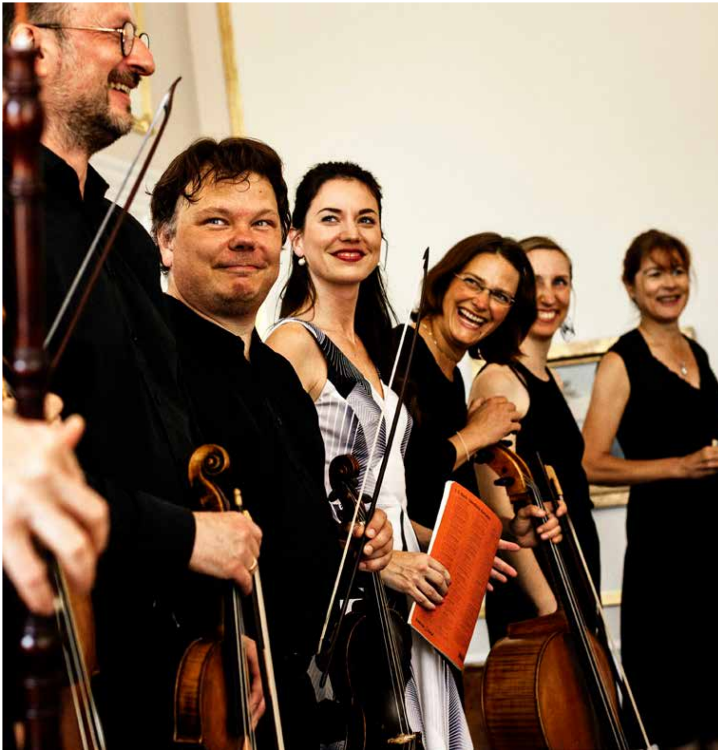
Concerto Copenhagen.

Odeum välkomnar trettioårsfirande Concerto Copenhagen till universitetet för en jubileumskonsert med några av de verk som fått en speciell betydelse för orkestern under de gångna åren. Vad sägs om Telemanns dråpliga Don Quijote svit eller en Battaglia av Heinrich Biber ? Till detta: Johann Sebastian Bachs älskvärda d-mollkonsert för oboe och violin. En minnesvärd kväll för alla älskare av tidig musik! Konserten sker i samverkan med Musik i Syd och Lunds Kammarmusiksällskap. ENTRÉ: 160/80 KR