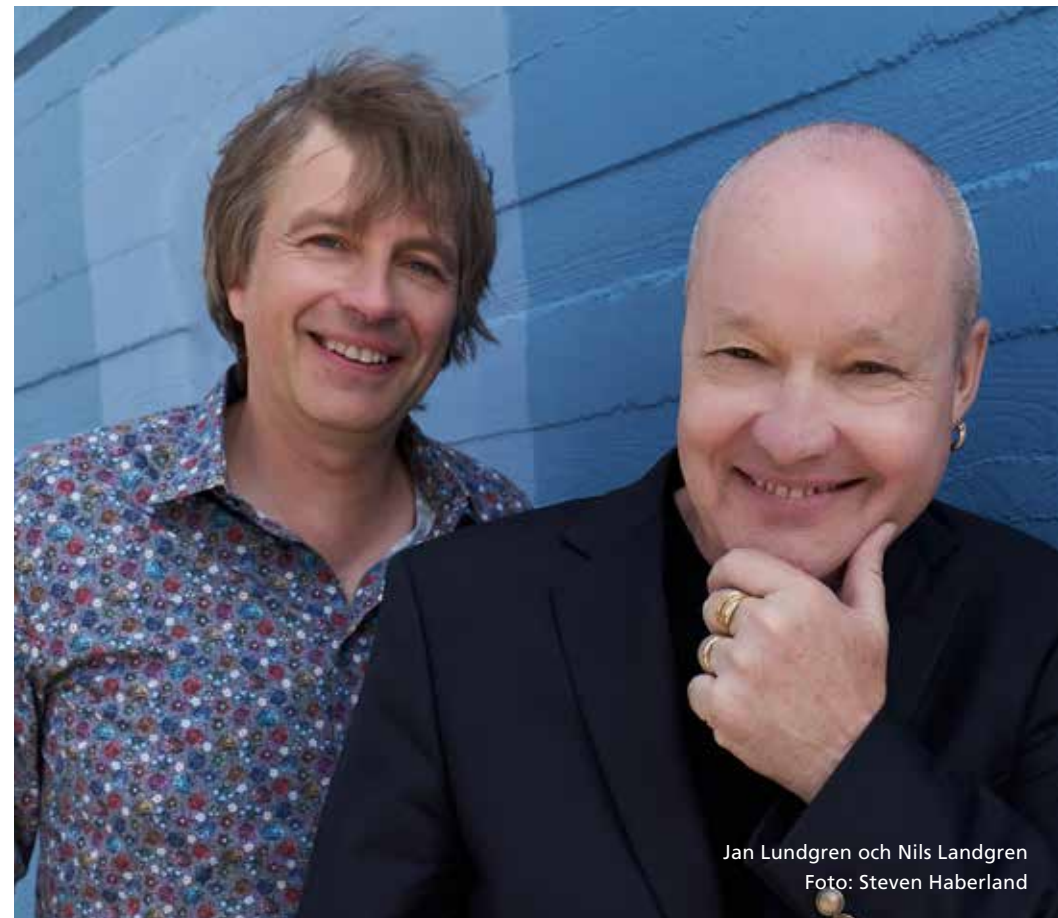
Jan Lundgren och Nils Landgren