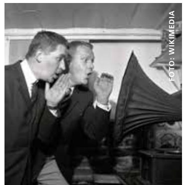
Hans Alfredson och Tage Danielsson