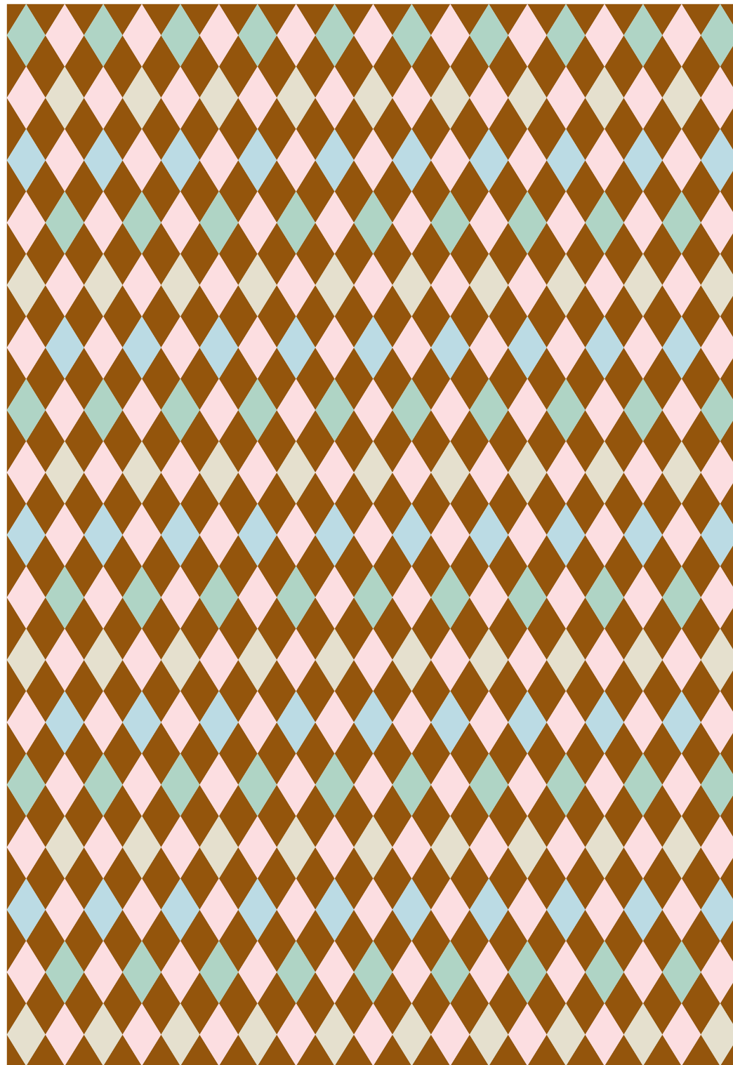
Foto: Pexels (s. 7), Unsplash (omslag, s. 8,12,13,15,16,19), Wikimedia (s. 8,14) Grafisk form: Media-Tryck, Lunds universitet